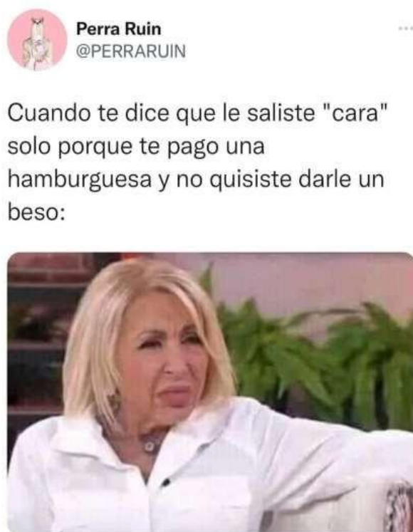
Figura 5. “Saliste cara” Cuarto caso de comentarios

Nota: https://www.facebook.com/share/UGdYZfXwJ5NnheHg/?mibextid=RqrPsF