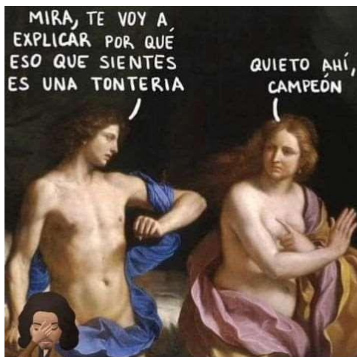
Figura 4. “Mansplaining” Tercer caso de comentarios sexistas.

Nota: https://www.facebook.com/share/oADS8XnLtt dwBLaJ/?mibextid=WC7FNe