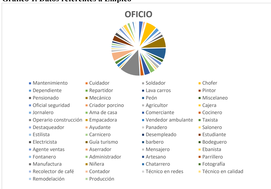
Gráfico 1. Datos referentes a Empleo