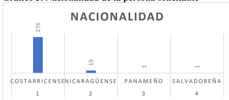
Gráfico 3. Nacionalidad de la persona solicitante