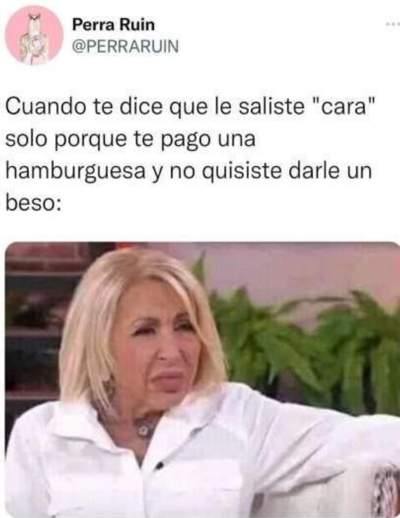
Figura 5. “Saliste cara” Cuarto caso de comentarios

Nota: https://www.facebook.com/share/UGdYZfXwJ5NnheHg/?mibextid=RqrPsF