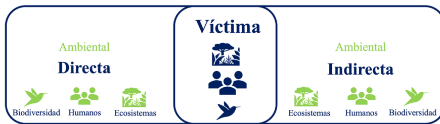
Figura 3. Tipología de víctimas en Victimología Verde

En estos niveles de interpretación podemos entender (en el nivel individual) a la víctima ambiental como aquellos humanos, ecosistemas, biodiversidad y procesos naturales que son afectados por conductas criminógenas y delictivas verdes (Carpio-Domínguez, 2023) y al igual que la victimología tradicional, las víctimas ambientales se pueden clasificar en dos tipos de acuerdo con el impacto del fenómeno victimizante: directas e indirectas (Villarreal-Sotelo, 2011) (Figura 3) trascendiendo la visión antropocéntrica tradicional en la que las víctimas sólo son los humanos: