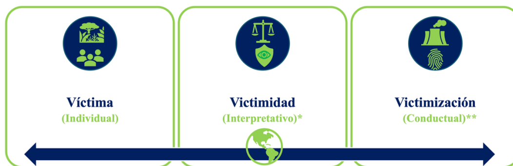
Figura 2. Niveles de interpretación de la Victimología Verde

Dentro del marco disciplinar, la victimología verde cuenta con su objeto de estudio a las víctimas verdes/ambientales/ecológicas; y siguiendo la herencia victimológica, la victimología verde cuenta con los niveles de interpretación: victima , victimidad y victimización (Villarreal-Sotelo, 2011) (Figura 2).