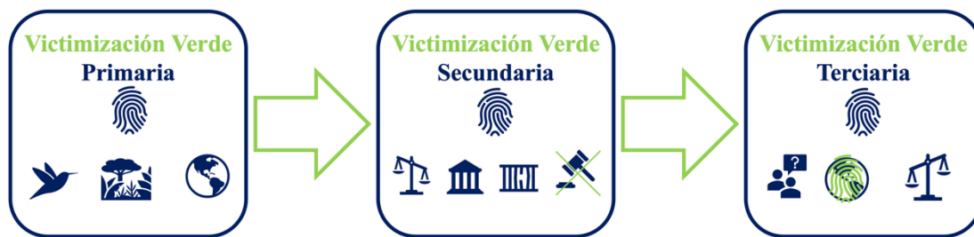
Figura 4. Tipologías de victimización verde.