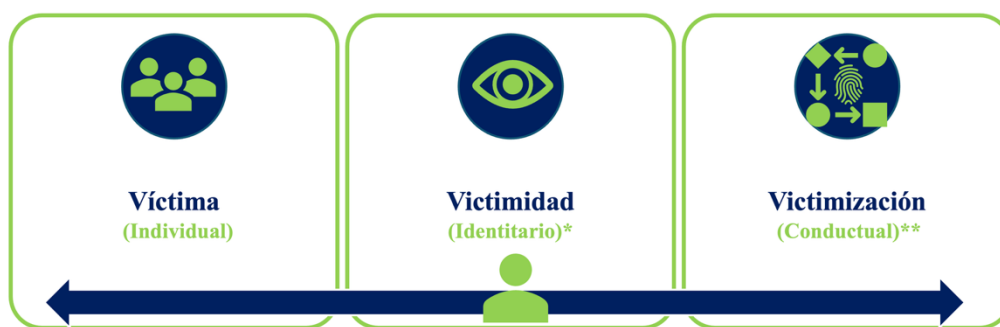
Figura 1. Niveles de interpretación victimológica.

Fuente: elaboración propia, con datos de Villarreal-Sotelo (2011).