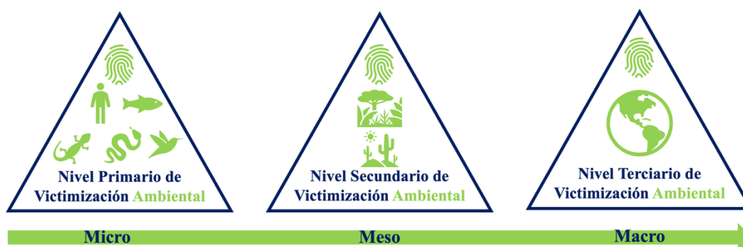
Figura 5.- Niveles de victimización verde.